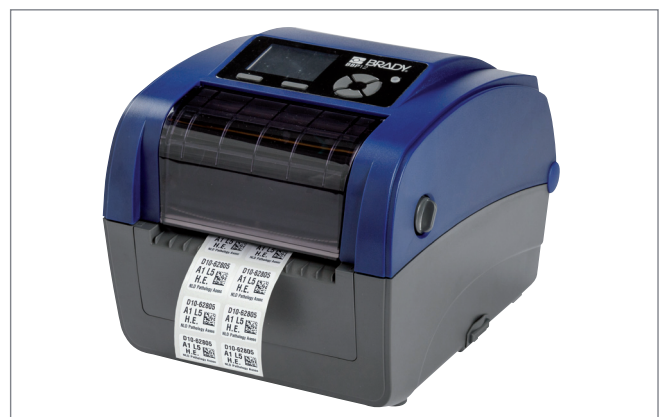
Schritt 3: Drucken